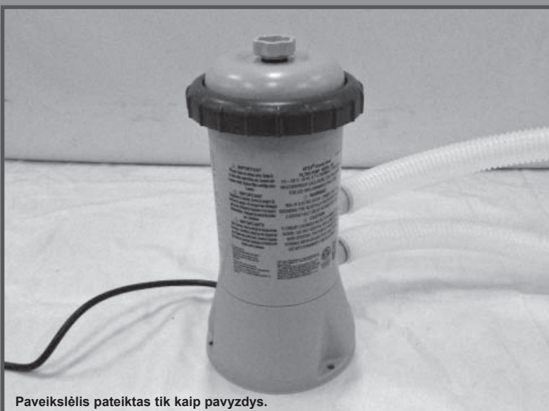
Paveikslėlis pateiktas tik kaip pavyzdys.

Nepamirškite išbandyti kitus kokybiškus „Intex“ gaminius: baseinus, priedus baseinams, pripučiamus baseinus ir žaislus, oro lovas ir valtis. Visus šiuos gaminius galite įsigyti parduotuvėje arba aplankę mūsų interneto svetainę.