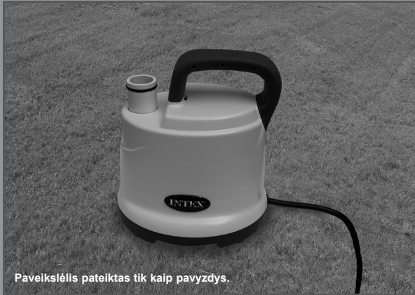
Paveikslėlis pateiktas tik kaip pavyzdys.

Nepamirškite išbandyti kitus kokybiškus „Intex“ gaminius: baseinus, priedus baseinams, pripučiamus baseinus ir žaislus, oro lovas ir valtis. Visus šiuos gaminius galite įsigyti parduotuvėje arba aplankę mūsų interneto svetainę. Dėl nuolatinių gaminių tobulinimų, „Intex“ pasilieka teisę keisti gaminio specifikacijas ir išvaizdą, todėl be išankstinio įspėjimo gali būti keičiamas vartotojo vadovas.