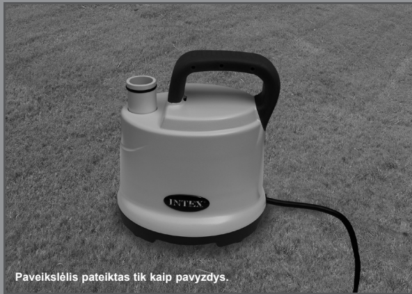
Paveikslėlis pateiktas tik kaip pavyzdys.

Nepamirškite išbandyti kitus kokybiškus „Intex“ gaminius: baseinus, priedus baseinams, pripučiamus baseinus ir žaislus, oro lovas ir valtis. Visus šiuos gaminius galite įsigyti parduotuvėje arba aplankę mūsų interneto svetainę. Dėl nuolatinių gaminių tobulinimų, „Intex“ pasilieka teisę keisti gaminio specifikacijas ir išvaizdą, todėl be išankstinio įspėjimo gali būti keičiamas vartotojo vadovas.